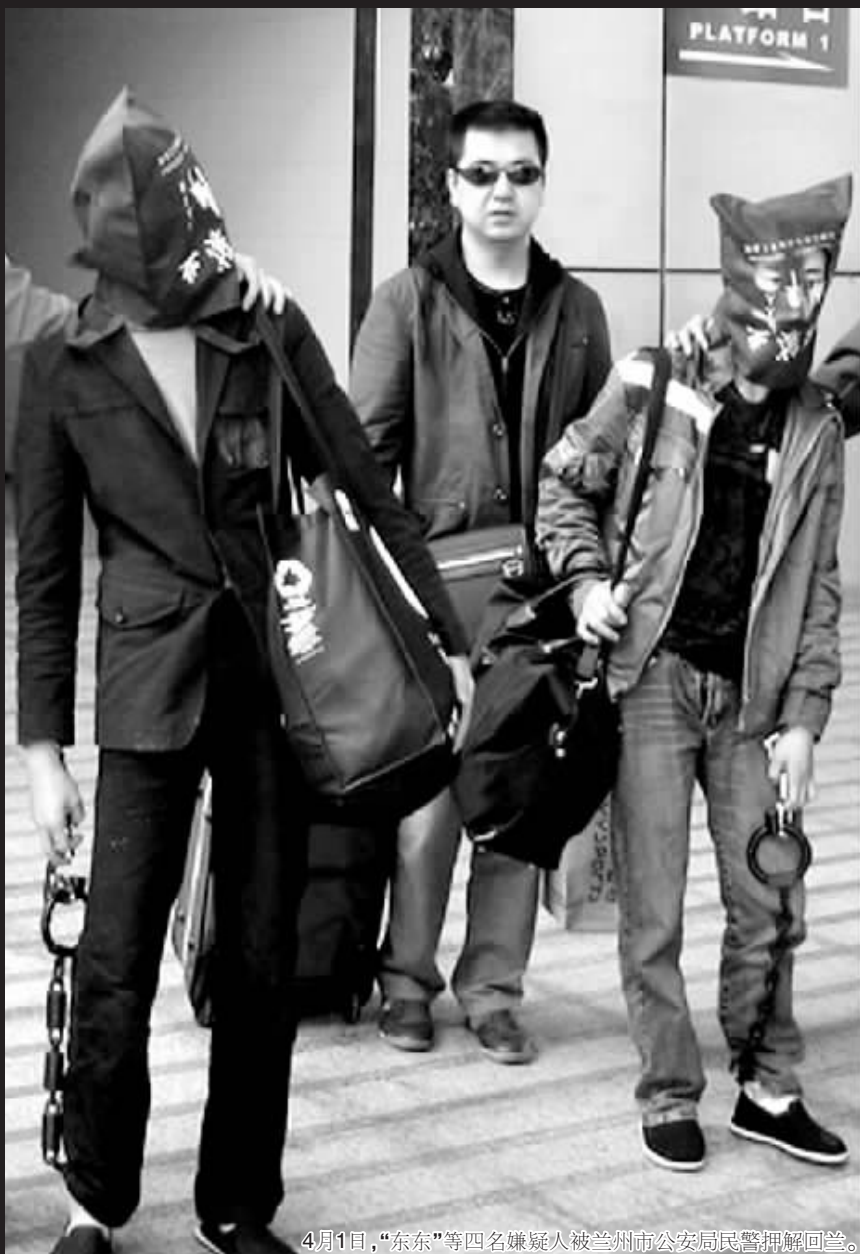
4月1日,“东东”等四名嫌疑人被兰州市公安局民警押解回兰。

昨日,兰州市公安局民警向记者揭开真相:这是一起由公安部统一协调指挥,甘肃和上海、成都警方大力配合,公安机关历时半年时间,成功摧毁的横跨甘、川、沪多个省区,贩卖新型毒品和枪支的特大地下贩毒网络,破获“2·17”公安部毒品目标案件,抓获犯罪嫌疑人8名,查获新型毒品冰毒410余克、麻古260多粒,贩毒轿车2辆,自制仿“六四式”手枪2支、子弹2发、称量毒品用的电子秤8台、毒资3万余元以及包装毒品的塑料袋3000余个。