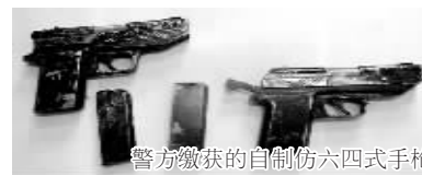
警方缴获的自制仿六四式手枪

10点多,院里行人渐渐多了起来。房间里有持枪歹徒,万一其狗急跳墙伤及群众怎么办?何况中午还有成群的孩子放学回家。面对这种状况,指挥部适时调整新的抓捕方案,决定等下午学生上学、院里群众少了以后再调集特警队员实施强攻。霎时,几十名特警荷枪实弹,狙击手选择制高点瞄准目标;消防战士开来消防车,架起云梯,高压水枪严阵以待;缉毒警和派出所民警封锁各个出入口,设立警戒带。